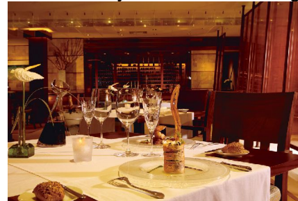
Le Swing - à la carte