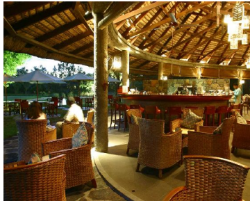
La Spiaggia – Mediterran