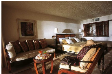
55 mit Meerblick

96 Junior Suiten (68qm) EG + 1.+2. OG 2 Erw + 1 Kind (bis 12 Jahre)