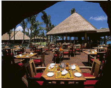
Indigo – Snacks, lunch