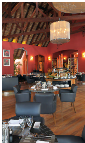
'Il Gusto' Italienische Küche