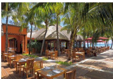
L 'Harmonie Internationale Küche /Buffets