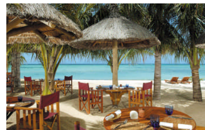
Le Morne Plage Seafood Restaurant

3 Bars: Le Cabanon (rustikale Beachbar) – Le Morne Plage Beachbar – Le Mahogany Bar&Terrasse – Le Martello The Club at Dinarobin