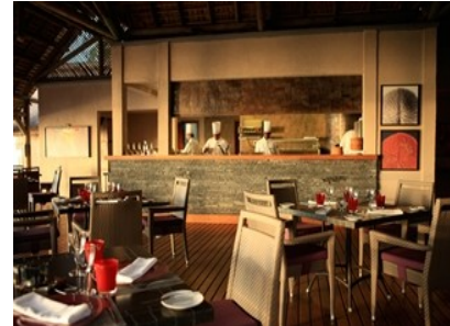
'Oasis' Pool Bars