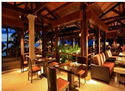
'Nautile' Lounge & Bar

'OberGINE' - Beachrestaurant Mediterranean