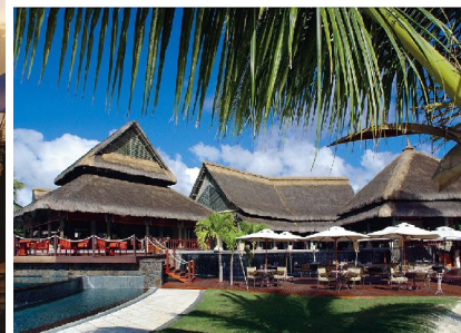
Le Beach Deck -Snacks