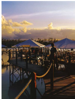
Le Barachois - à la carte