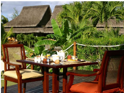
L'Archipel - Themenbuffets

Hoteleinrichtungen: - 3 Restaurants - 2 Bars