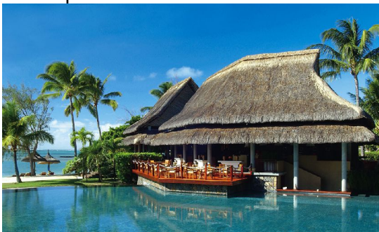
- Laguna Bar -abends dezent Musikunterhaltung