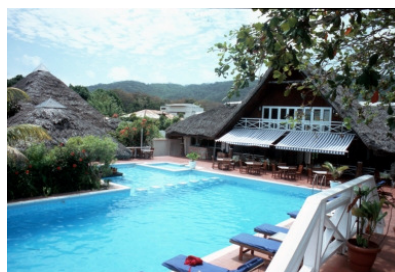
Haupthaus mit Lobby, Bar